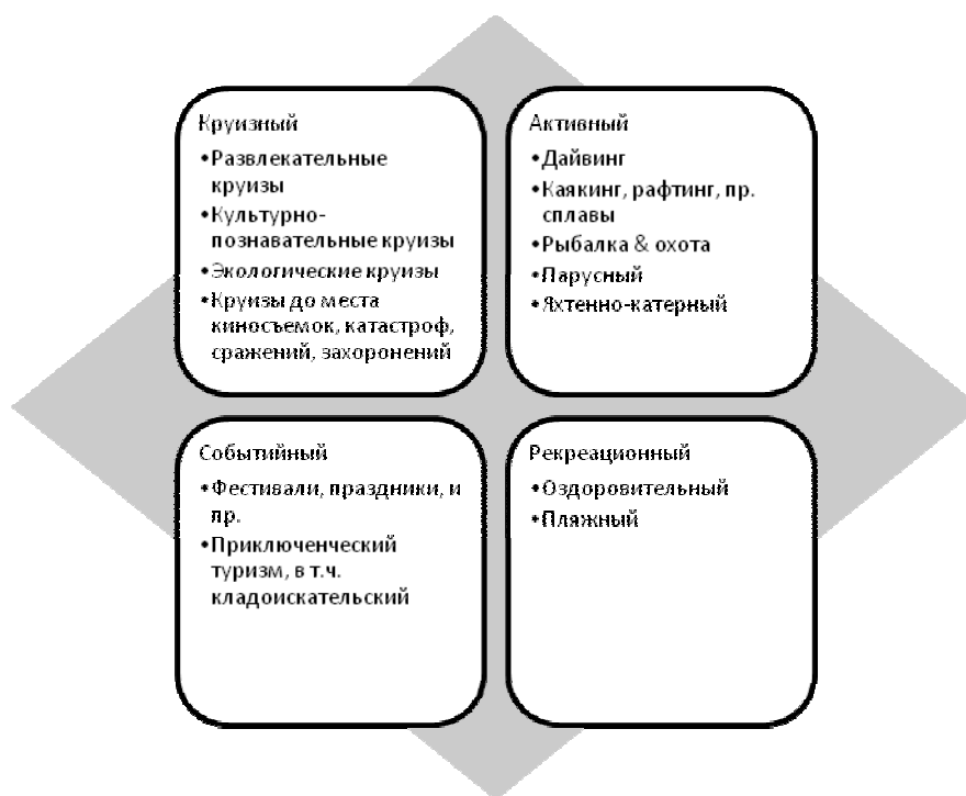
Рисунок 2 – Типология водного туризма

плавания и навигации, облегчения различного рода формальностей, особенно в случае использования международных водных путей.