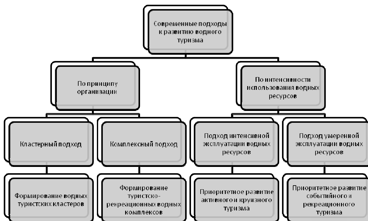
Рисунок 3 – Стратегические подходы к развитию инфраструктуры водного туризма

Стратегические подходы к развитию водного туризма и соответствующей инфраструктуры возможно разделить по двум критериям. По критерию принципа организации они делятся на кластерный и комплексный. Реализация кластерного подхода предполагает формирование водного туристского кластера с необходимой инфраструктурой, значимое место в котором занимают научные, исследовательские, образовательные институты. Кластерный подход зачастую реализуется применительно к маршруту и объекту водного туризма, отличается активным брендингом.